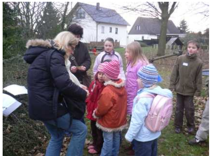
Bilder der Spürnasenaktion in Münster-Sarmsheim