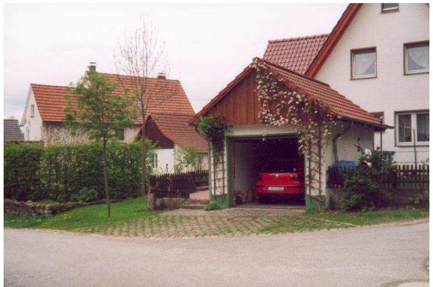
Einige Fotos aus Ottenhausen (von Frau Franzen)